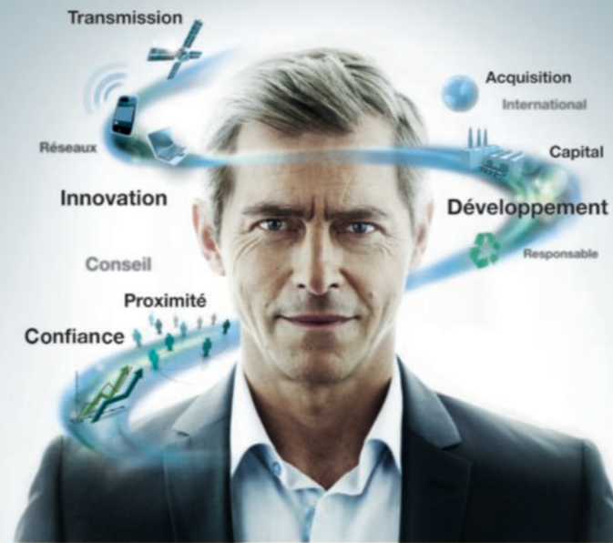
GFA Links - RCS Nantes B 328 330 717 - 120273 - 06/2012