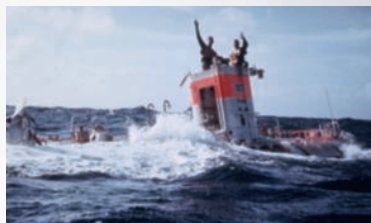
Record de plongée dans la Fosse des Mariannes en 1960 par Jacques Piccard et Don Walsh.